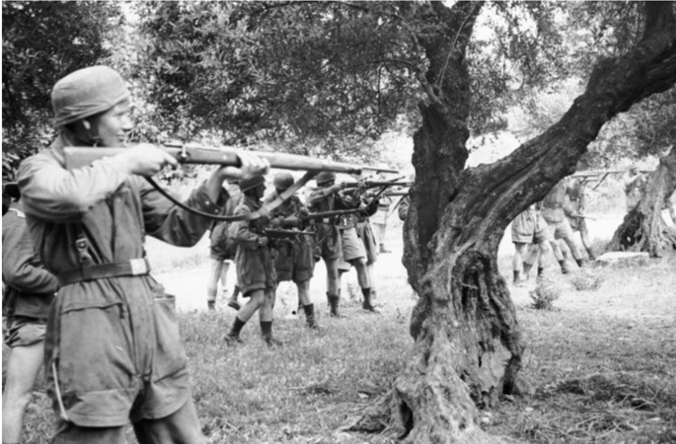
2. Juni 1941