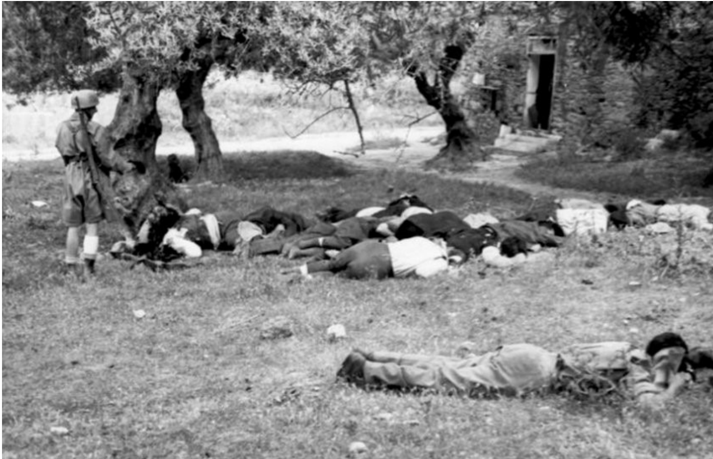
2. Juni 1941